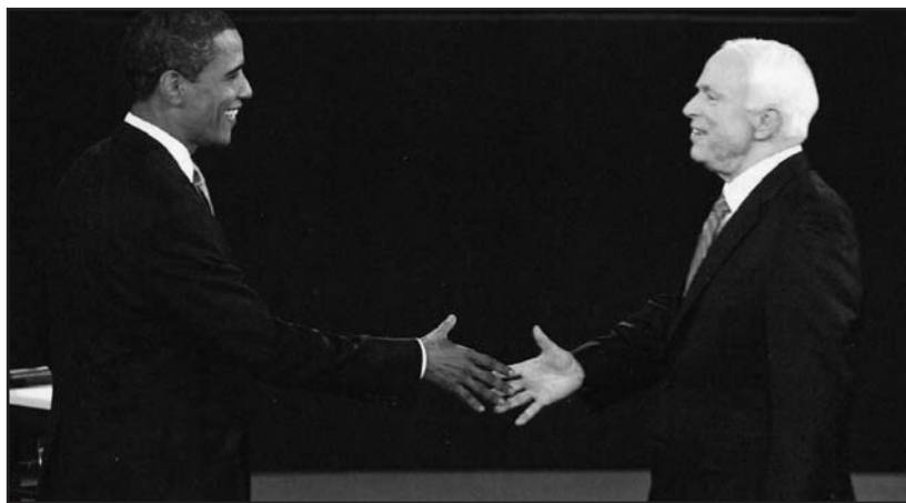
Barack Obama e John McCain.