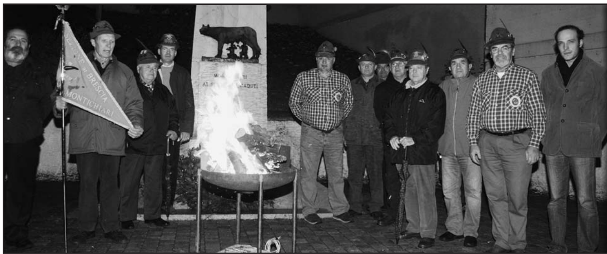
I partecipanti alla manifestazione.