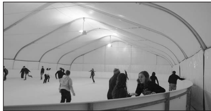
Il palaghiaccio di Montichiari.

struttura in via Brescia a Montichiari è aperta ogni venerdì dalle 20,30 alle 23,30, sabato dalle 15 alle 18 e dalle 20,30 alle 23,30 e domenica dalle ore 10 alle 12 e dalle ore 14,30 alle 19. Per informazioni ed iscrizioni telefonate al 333 1680086.