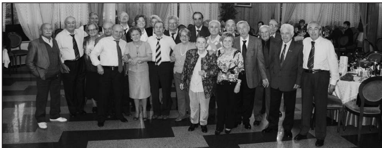
Foto ricordo della classe 1935 al Green Park Boschetti.

Termino invitando tutti a credere in questa meravigliosa parola "speranza" anche nei momenti difficili della nostra vita, sia di carattere economico, passionale che di salute, tenendo sempre presente quanto possa essere ancora bella e luminosa la strada della vita, non dimenticando poi che il saggio dice: SPERA MA AGISCI".