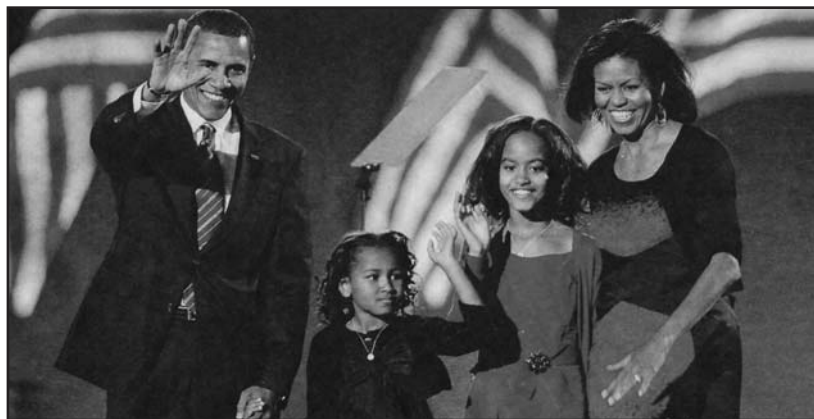
Barack Obama, con la moglie Michelle e le figlie Sasha e Malia, saluta la folla dal palco del Grant Park di Chicago.

Dunque, dopo due millenni la storia si ripete, in una grande lezione di democrazia che ci viene dall'America. Un uomo