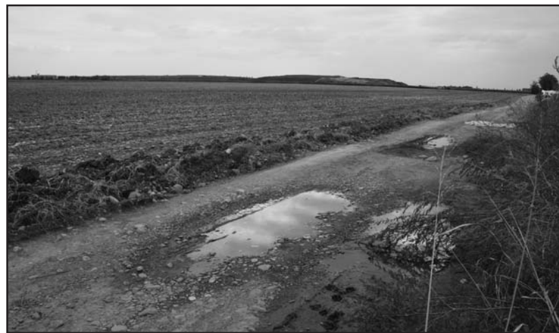
Lo stato pietoso delle vicinali nella zona cave.