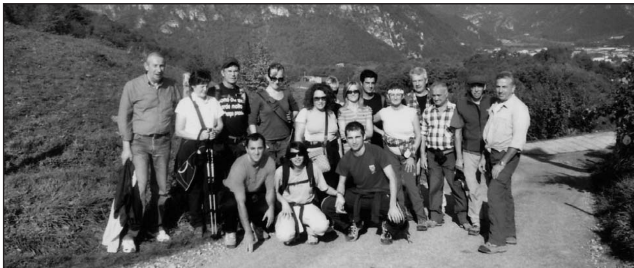
Gli escursionisti del C.A.I. di Montichiari nell'ultima uscita della stagione.