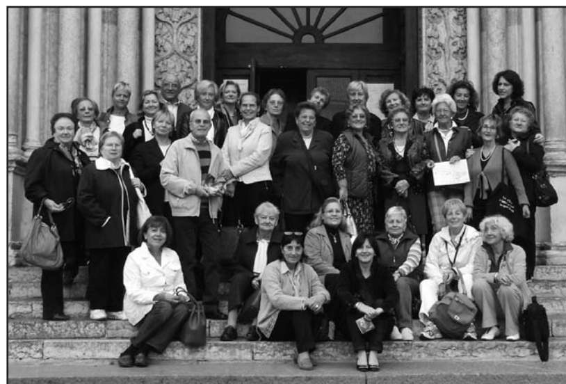
Monteclaresi a Parma per la mostra del Correggio.